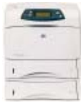
Impresora HP LaserJet 4350tn