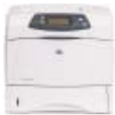
Impresora HP LaserJet 4350n