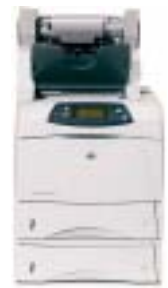
Impresora HP LaserJet 4350dtnsl