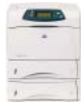
Impresora HP LaserJet 4350dn