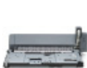
Unidad de impresión a doble cara automática

Expanda la capacidad de entrada de la impresora HP LaserJet 5200 a un máximo de 850 hojas, instalando la bandeja 3 opcional de 500 hojas (estándar en los modelos 5200tn y 5200dtn).