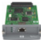
Servidor de impresión interno HP Jetdirect

Imprima documentos profesionales y ahorre tiempo con la unidad de impresión a doble cara automática (estándar en el modelo 5200dtn).