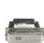
Disco duro de alto rendimiento EIO

Obtenga conectividad inalámbrica con el servidor de impresión externo HP Jetdirect ew2400 inalámbrico 802.11b y Fast Ethernet conectado a través del puerto USB de alta velocidad.