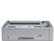
Bandeja de entrada para 500 hojas

Expanda la capacidad de entrada de la impresora HP LaserJet 5200 a un máximo de 850 hojas, instalando la bandeja 3 opcional de 500 hojas (estándar en los modelos 5200tn y 5200dtn).