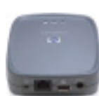
Serv. de impresión ext. inalámbrico HP Jetdirect

Aumente la eficiencia y la seguridad instalando el servidor de impresión interno HP Jetdirect 635n IPv6/IPsec y Gigabit Ethernet en la ranura EIO disponible.