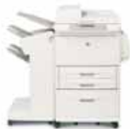
HP LaserJet 9040/9050mfp con finalizador apilador

Cada bandeja se puede asignar a un usuario, grupo de trabajo o departamento para que recoger los trabajos sea muy sencillo. El multibuzón clasificador también se puede configurar como clasificador/compaginador, apilador y separador de trabajos.