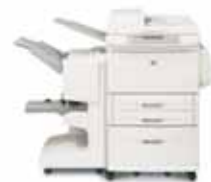
HP LaserJet 9040/9050mfp con finalizador multifuncional

Permite apilar hasta 3.000 hojas y grapar hasta 50 hojas de papel por trabajo en varias posiciones.