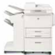
HP LaserJet 9040/9050mfp con finalizador/grapadora

Permite apilar hasta 3.000 hojas de papel con separación de trabajos.