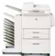
HP LaserJet 9040/9050mfp con buzón de 8 bandejas

Cable de alimentación, cartucho de impresión, documentación de la impresora, software de la impresora en CD-ROM, recubrimiento del panel de control, dos bandejas de entrada estándar de 500 hojas, una bandeja multipropósito de 100 hojas, bandeja de entrada de 2.000 hojas, accesorio de impresión automática a doble cara (preinstalado), servidor de impresión incorporado HP Jetdirect, alimentador automático de documentos. Debe elegir y solicitar el dispositivo de salida de papel deseado por separado.