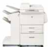
HP LaserJet 9050mfp con finalizador/apilador opcional

Para departamentos comerciales y de empresa, y múltiples departamentos de empresas medianas, con grupos de trabajo de 30 a 50 usuarios que requieran un acceso en red sencillo a funciones rápidas, fiables y económicas de impresión y copiado en blanco y negro hasta en A3, escaneado en color y una serie de opciones de fax, acabado de documentos y envío digital, para aumentar la eficiencia, mejorar la productividad y racionalizar los procesos de trabajo.