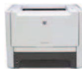
Impresora HP LaserJet P2014