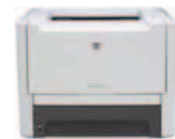
Impresora HP LaserJet P2014n