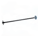
Q6708A Eje para alimentador de rollos de 60 pulgadas/1524 mm para HP Designjet