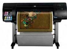
Impresora fotográfica HP Designjet Z6100 de 1.067 mm

Esta impresora HP Designjet de gran formato proporciona hasta 105,4 m 2 de salida por hora, calidad fotográfica duradera con 8 tintas pigmentadas HP Vivera y una extraordinaria uniformidad del color con un espectrofotómetro integrado 1 .