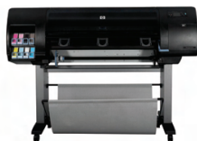
Impresora fotográfica HP Designjet Z6100ps de 1.067 mm