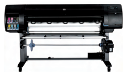
Impresora fotográfica HP Designjet Z6100ps de 1.524 mm

Ideal para proveedores de servicios de impresión, tanto laboratorios de producción de fotografía como empresas de arquitectura, ingeniería y GIS que desean reducir su tiempo de respuesta y producir aplicaciones de interiores de gran impacto y alta calidad con colores precisos y de larga duración, como cartelería para punto de venta, impresiones fotográficas, arte digital, dibujos, mapas y presentaciones.