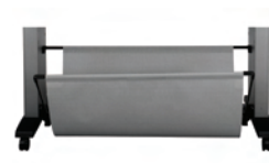
Q6714A Bandeja de soporte de 60 pulgadas/1524 mm para HP Designjet