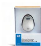
Q6695A Solución de creación y gestión avanzada de perfiles HP