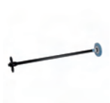
Q6707A Eje para alimentador de rollos de 42 pulgadas/1067 mm para HP Designjet