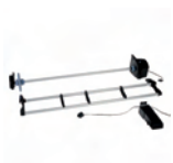
Q6706A Rollo de 1067 mm para HP Designjet Z6100