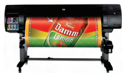
Impresora fotográfica HP Designjet Z6100 de 1.524 mm