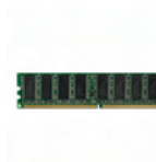
Q5673A Actualización de memoria HP Designjet 256 MB